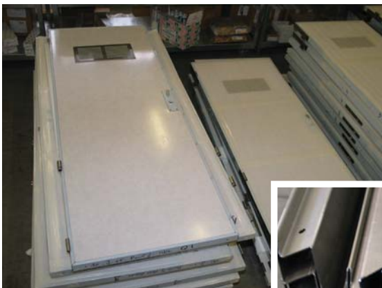
Esempi di porte con relativi telai realizzati da MBM. Si noti il preciso lavoro di piegatura della lamiera precedentemente tagliata con il laser

Nella visita all'officina abbiamo infatti intravisto prototipi di mobili in metallo già decorato, con componenti rivettati e privi di ogni saldatura, utili per le navi da carico o per quelle militari dove non vengono accettati prodotti in legno, infiammabili. Accanto ai mobili, abbiamo anche visto letti abbattibili in metallo, realizzati in lamiera stampata. Certamente una grande evoluzione finalizzata a ridurre l'incidenza dei prodotti custom , aumentando la percentuale delle lavorazioni automatiche da eseguire su turni non presidiati.