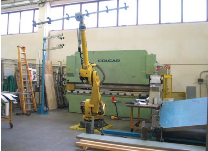
Piegatrice Colgar, con sistema di movimentazione robotizzata della lamiera, installata presso la società MBM

Plafone luminoso realizzato da MBM in lamiera tagliata al laser e successivamente saldata manualmente. Questo componente è montato al centro di un salone di una nave traghetto