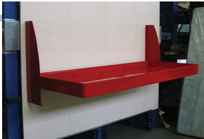
Letti abbattibili in metallo realizzati in lamiera stampata da MBM

correggendo, in maniera automatica, i parametri utilizzati, al fine di ristabilire la qualità desiderata. Sulla base degli elementi sopra descritti, l'aggiunta di questa opzione ha contribuito in maniera sostanziale alla decisione di acquistare il sistema Zaphiro che, da pochi mesi, opera con pieno successo nella nostra fabbrica".